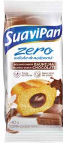
BAUNILHA C/ CHOCOLATE