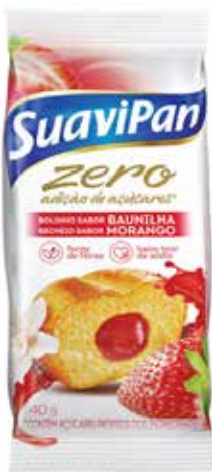
BAUNILHA C/ MORANGO