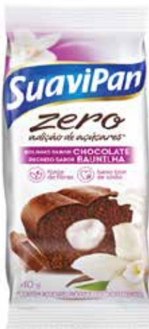
CHOCOLATE C/ BAUNILHA