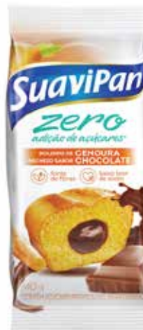
CENOURA C/ CHOCOLATE