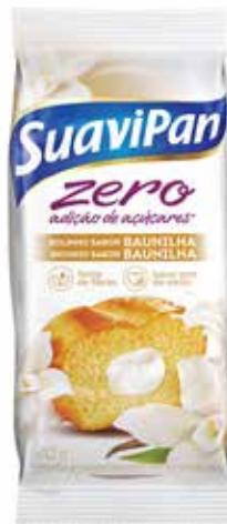
BAUNILHA C/ BAUNILHA