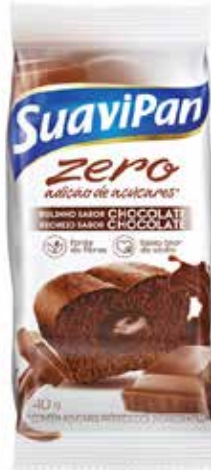
CHOCOLATE C/ CHOCOLATE